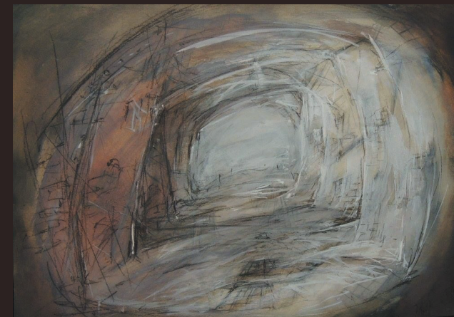
A. Berg „Wozzeck” – projekt dekoracji