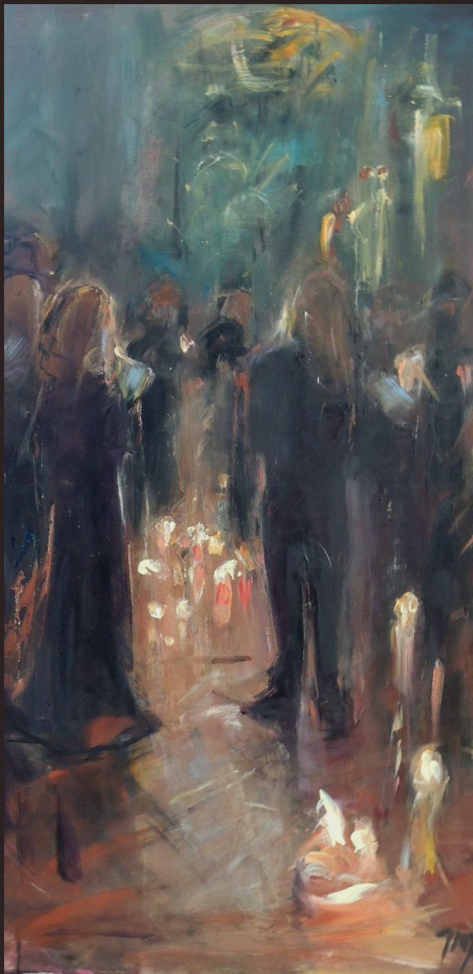
Muzyka w Jarosławiu